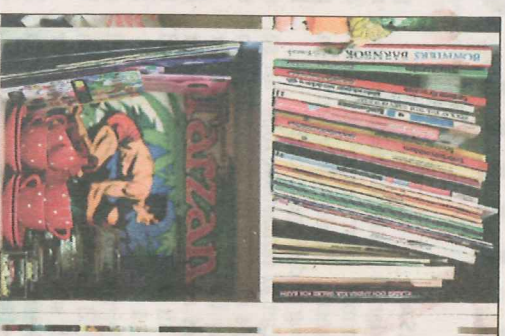
Begagnat är bäst.